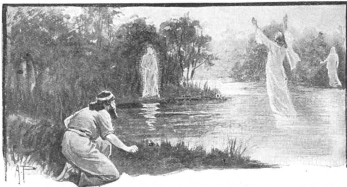
“All these things shall be finished.”—Dan. xii. 7.

12:7 我听见那站在河水以上，穿细麻衣的，向天举起左右手，指着活到永远的主起誓说，要到一载，二载，半载，打破圣民权力的时候，这一切事就都应验了。