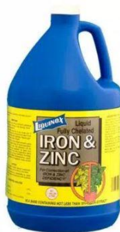
Liquinox 1 Gal. Liquid Iron and Zinc Fertilizer