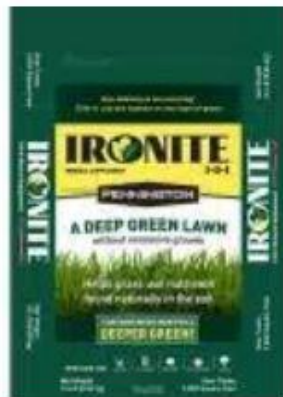
Ironite 15 lbs. 1-0-1 5M Fertilizer